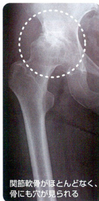
関節軟骨がほとんどなく、骨にも穴が見られる